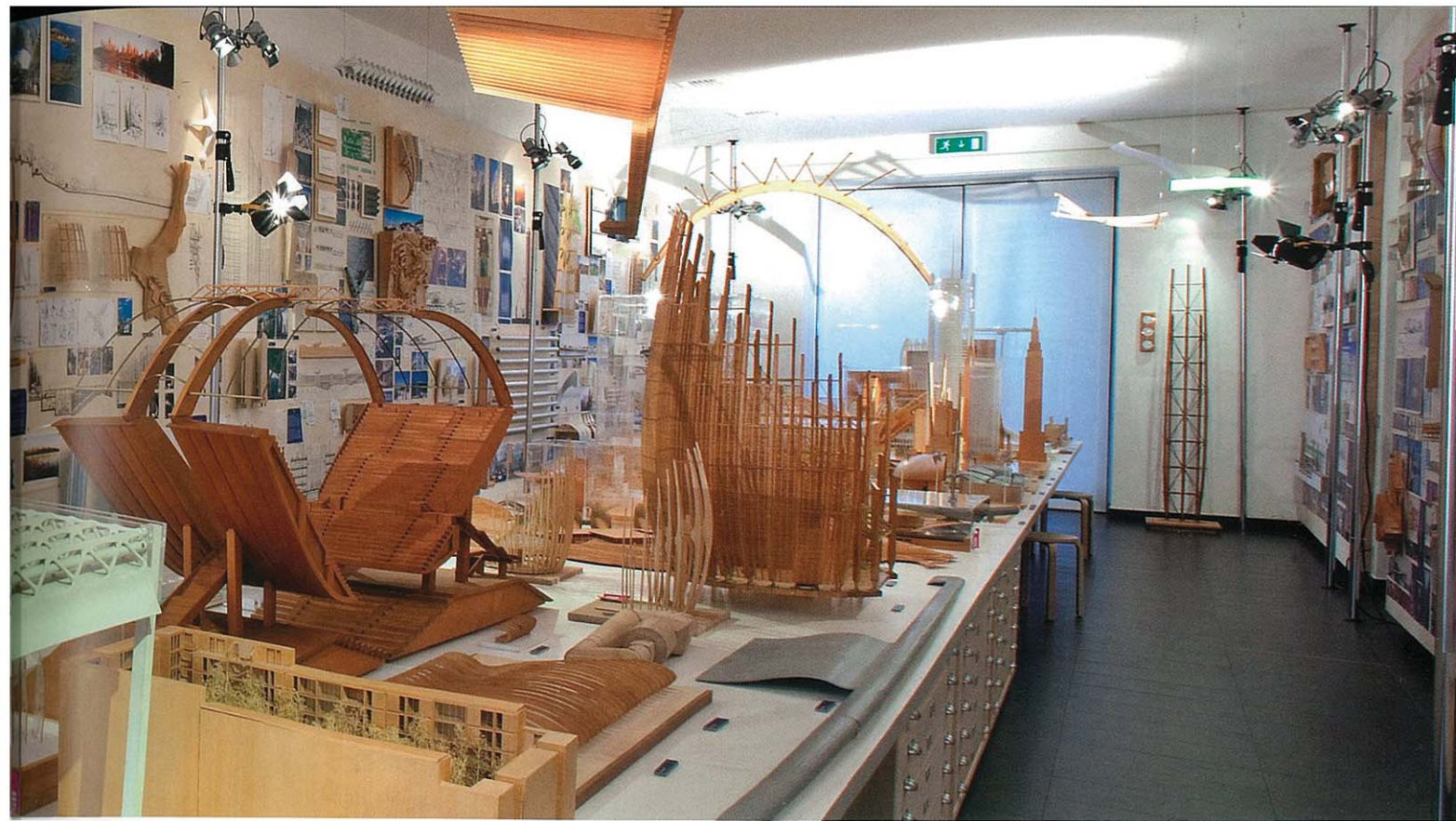
↑ Interno della Fondazione Renzo Piano, l'Archivio Vivo ↙ Studenti a bottega

F ondazione nella nostra lingua è un vocabolo strano, ambiguo. Ciò che sintatticamente prelude a qualcosa di nuovo, che deve ancora venire, diviene spesso puro tributo, ricordo museale di grandi interpreti dei quali il talento non si può saggiare che nelle opere di ieri. Non sempre, però. Milly Rossato e Lia Piano, moglie e figlia di Renzo Piano e frontwomen di Fondazione Renzo Piano, ci spiegano il ruolo formativo che una fondazione sui generis può assumere per gli architetti di domani.