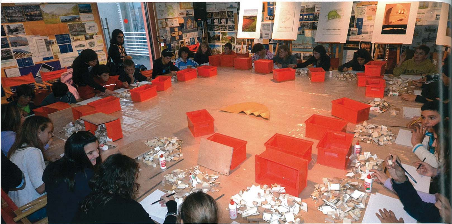
↑ Scuole elementari in visita alla Fondazione Renzo Piano

premio biennale destinato a giovani architetti italiani per accompagnarli nei primi anni di lavoro, spesso i più difficili. Quanti e quali progetti sono attualmente in corso e in che modo la Fondazione affianca lo studio nel loro sviluppo?